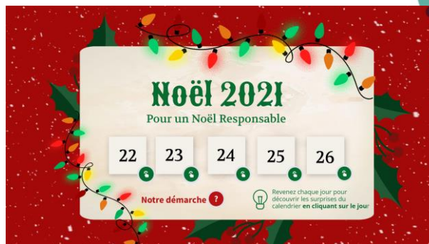
Calendrier de l'avant responsable