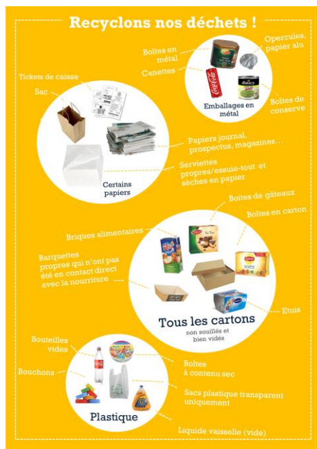
Tri des déchets