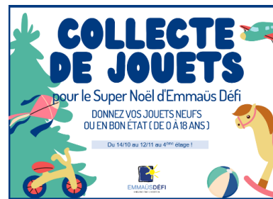
Collecte de jouets