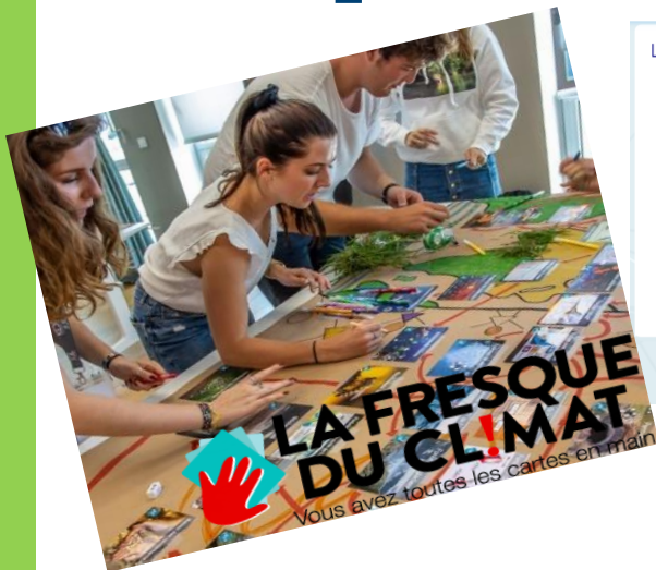
Invitation à la Fresque du Climat