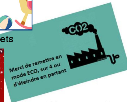
Etiquette sur les chauffages Oresys